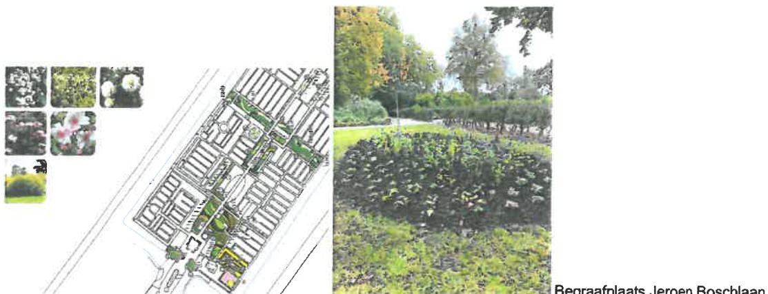
Begraafplaats Jeroen Boschlaan

Er zijn twee groenontwerpen opgeleverd; één voor een nieuwe akker Asbestemmingen op de begraafplaats Munnikensteeg en één voor de begraafplaats Jeroen Boschlaan. Op de laatste begraafplaats betreft het vooral het vervangen van de beplanting op het "oude" gedeelte. Er wordt in 2021 uitvoering aan de ontwerpen gegeven, waarover hierna meer informatie.